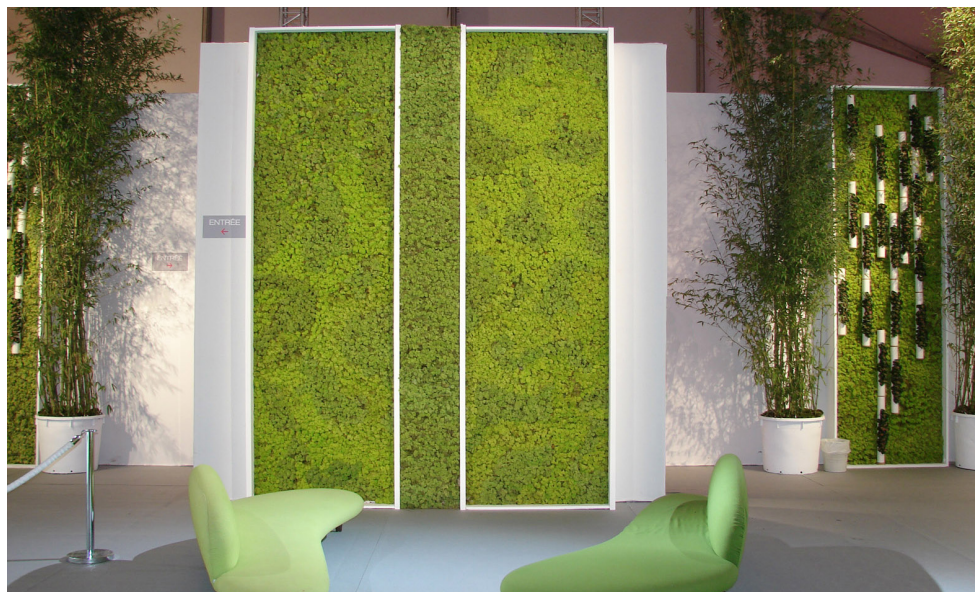
Tarifs sur devis