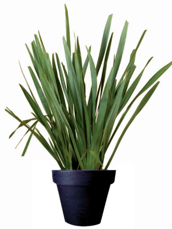
Réf. 112.300 - Phormium ht 1,20 à 1,50 m Réf. 134.359 - Vas three noir