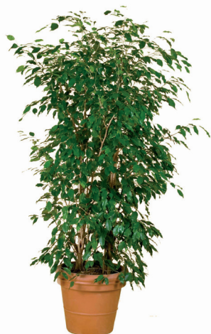
Réf. 113.160 - Ficus ht 1,80 m à 2 m