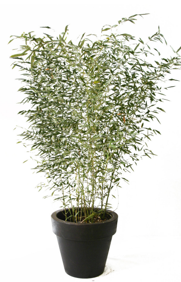
Réf. 111.110 - Bambou touffe ht 1,50 à 2 m Réf. 134.359 - Vas three noir