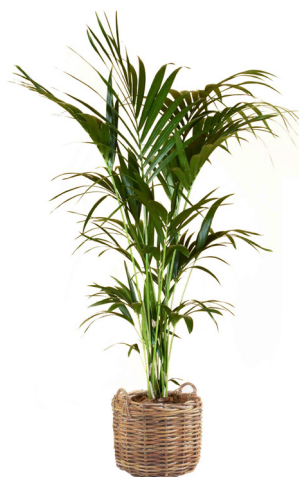
Réf. 113.200 - Kentia ht 1,80 à 2 m Réf. 136.300 - Vannerie osier