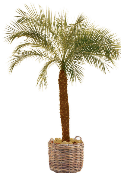
Réf. 113.230 - Phoenix roebelinii ht 1,80 - 2,10 m Réf. 136.300 - Vannerie osier