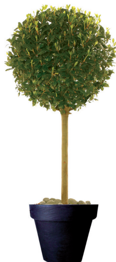
Réf. 112.160 - Laurier tige boule ht 1,80 m Ø 60 cm Réf. 134.359 - Vas three noir