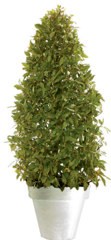
Réf. 112.135 - Laurier cône ht 1,50 m Ø 40/50 cm Réf. 134.363 - Vas three blanc

At Gally, we pride ourselves with the reputation of our presentations of both popular and exotic plant selections, presented in standard or tailor-made containers and designed to suit all tastes and decors. The objective is never to clash with or change the existing environment. Our specialists seek to create floral displays that blend with, and enhance, the beauty of the existing colour schemes and atmosphere.