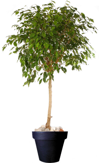
Réf. 123.220 - Ficus tige boule Ø 1,20/1,50 m - ht 2,50 à 3 m Réf. 134.359 - Vas three noir