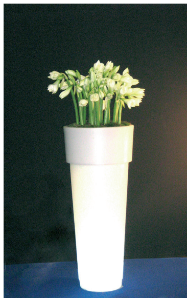
Réf. 134.320 A - Bac Marcantonio light Ø50 cm ht 1,20 m avec Arums blancs

The Gally Design Centre is staffed by knowledgeable and innovative experts who are ready to respond to every customer request. Whether a standard selection or a bespoke solution, our master gardeners guarantee an unsurpassed level of professional advice, project execution and customer satisfaction.