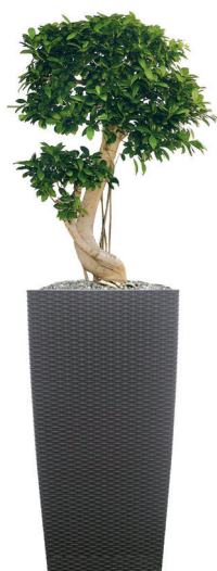
Réf. 113.410 A - Bonsai ficus nitida en bac Kubis cottage ht totale 1,20 m à 1,50 m

No floral selection or composition is beyond the capability or creativity of our master gardeners. We guarantee to find the right arrangements for you.