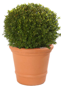
Réf. 111.125 - Buis boule Ø 35/40 cm ht 0,50 m