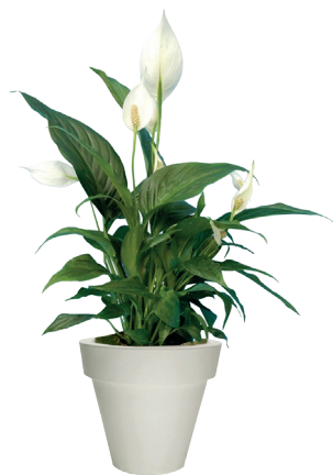
Réf. 113.310 - Spatiphyllum Sensation ht 1,20 à 1,50 m Réf. 134.363 - Vas three blanc