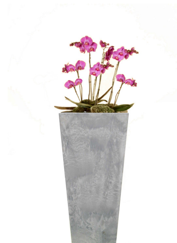
Réf. 113.410 C - Orchidées en bac Arstone ht totale 1 à 1,10 m