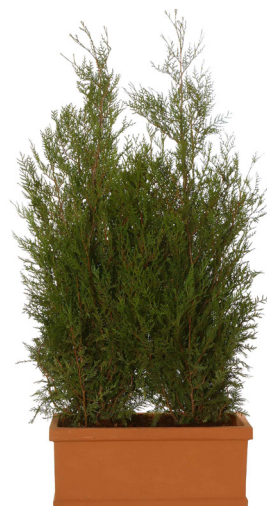
Réf. 142.900 - Haie de végétaux d'extérieur ht 1,50m