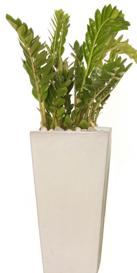
Réf. 113.410 B - Zamioculcas en bac Kubis blanc ht totale 1,30 m à 1,50 m