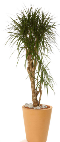
Réf. 113.130 - Dracaena maginata ht 1,80 à 2 m