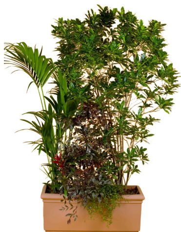
Réf. 143.200 - Bac composé rectangle 100 x 32 cm