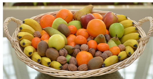
Réf. Pafruit 10K