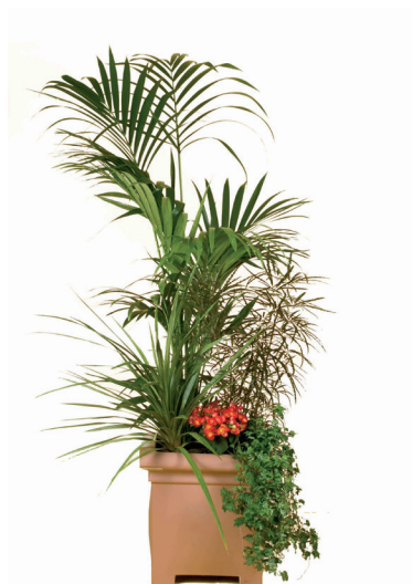
Réf. 141.100 à 144.400 Bac composé carré ou rond