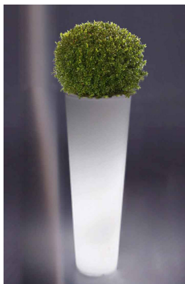
Réf. 134.326 A - Bac PVC New Pot Maxi light Ø44 cm ht 1,20m avec buis boule Ø45 cm