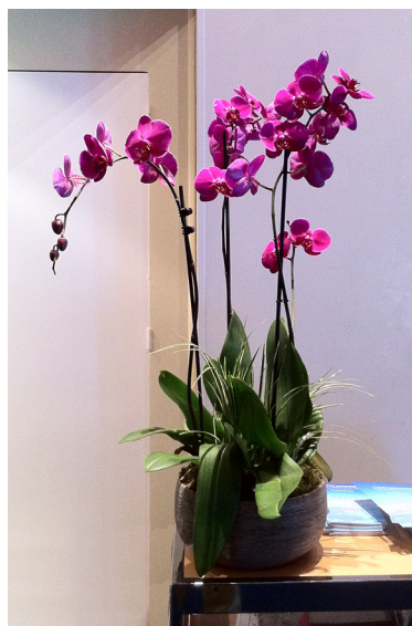
Réf. 182.200 - Coupe fleurie Ø 30 cm