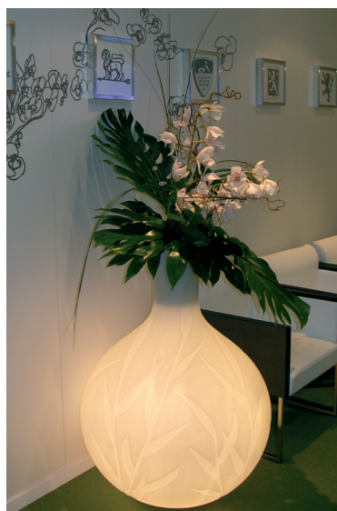
Réf. 134.300B - Bac Princess Light Ø 75 cm ht 1 m avec Orchidées et feuillages