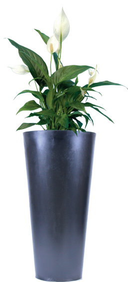
Réf. 113.300 A - Spatiphyllum sensation en bac Partner ht 1,80 à 2 m