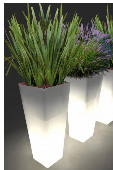
Réf. 134.327 A - Bac PVC Kubis ASQ light 46 x 46 cm ht 1,10m avec Phormiums