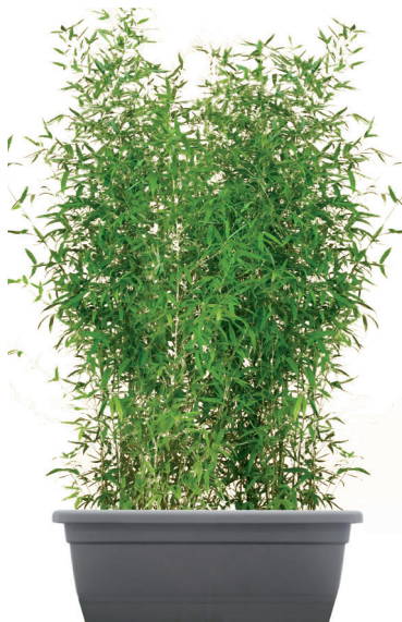
Réf. 142.960 - Haie de Bambous ht 2 à 2,50 m