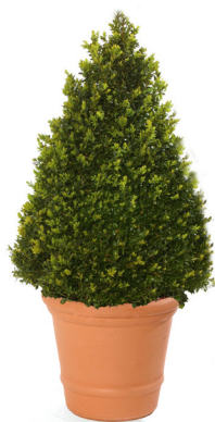
Réf. 111.140 - Buis cône Ø 50 cm ht 1 à 1,20 m