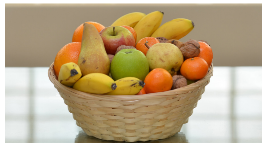
Réf. Pafruit 05K