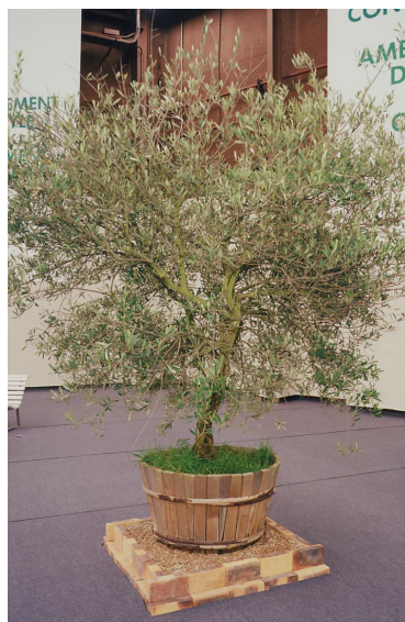
122.160 Olivier vieux tronc Ø 1,50 m - ht 2,50 à 3 m